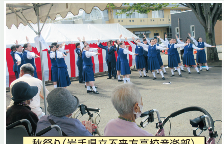
秋祭り(岩手県立不来方高校音楽部)