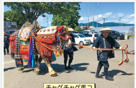
チャグチャグ馬コ