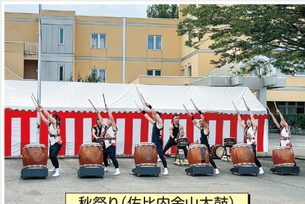
秋祭り(佐比内金山太鼓)